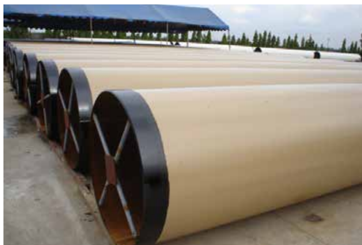
Belzona 5811 utilisé pour protéger un tuyau enterré

Belzona 5811DW2 est approuvé par la WRAS pour le contact avec l'eau potable.