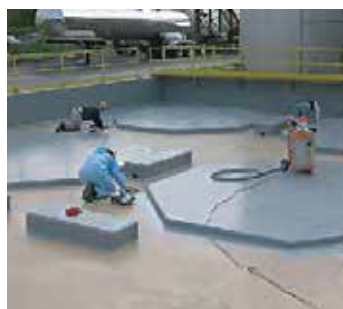
Protection des bacs de rétention