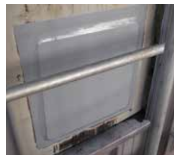
Protection des réparations