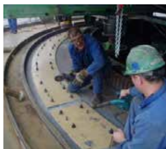
Collage par injection