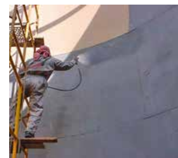
Revêtement des réservoirs

Pour plus d'informations, contactez votre représentant local Belzona :