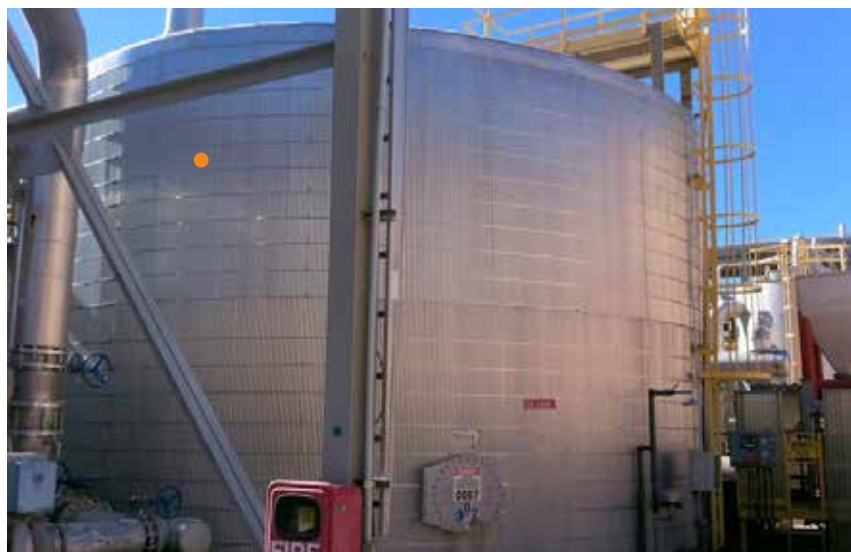
Belzona 4331 peut être appliqué aux réservoirs en tant que couche de protection

Pour plus d'informations, contactez votre représentant local Belzona :