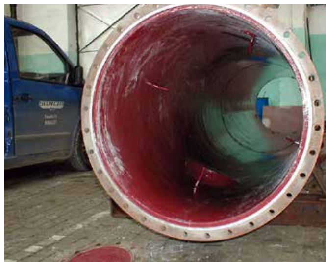
Protection supplémentaire appliquée à une tour de réaction chimique

Ce revêtement est appliqué à froid sans travail à chaud ni outils spéciaux.