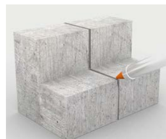
Mastic pour joints sur les gradins et les marches

Pour plus d'informations, contactez votre représentant local Belzona :