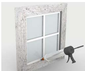
Mastics résistants aux intempéries pour les portes, les fenêtres et autres ouvertures