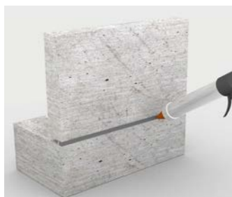
Mastic résistant aux intempéries pour les bases en béton