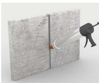
Mastic pour joints de dilatation sur les structures verticales