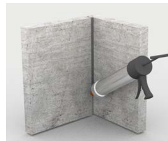
Mastic pour joints de dilatation sur les murs adjacents