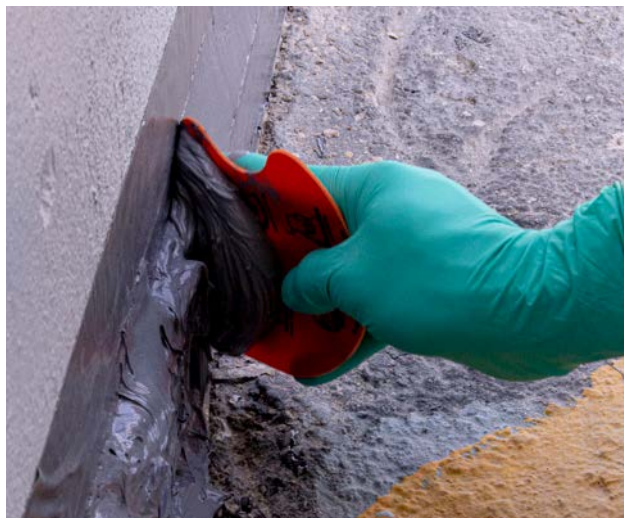
Utilisé pour reconstruire les joints endommagés dans les zones de confinement

Application manuelle sans travail à chaud ni outils particuliers pour réduire les temps d'arrêt.