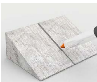
Mastic pour joints sur les rampes d'accès en béton