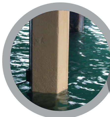
Pilotis en béton