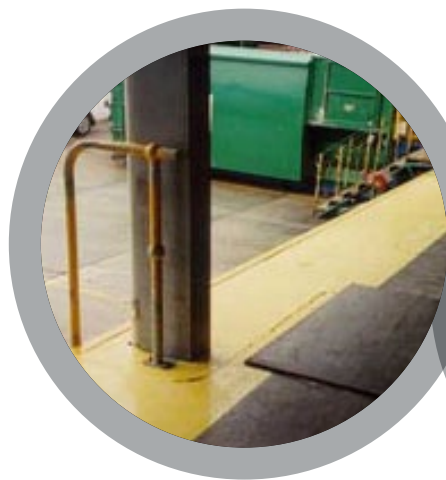
Quais de chargement