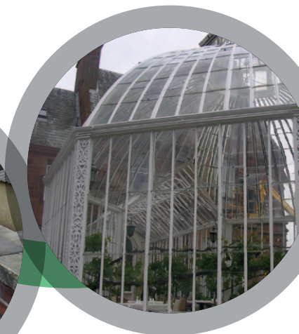
Cadres de verrière