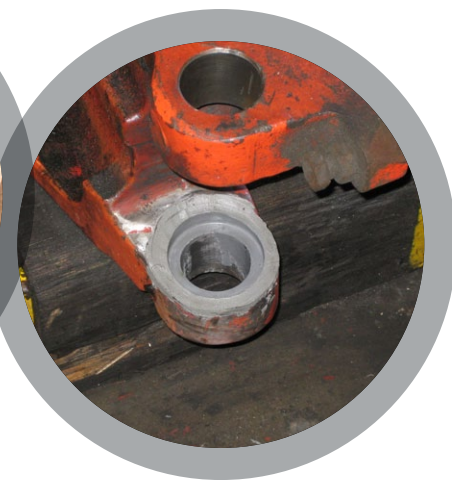
Remise en place de butées