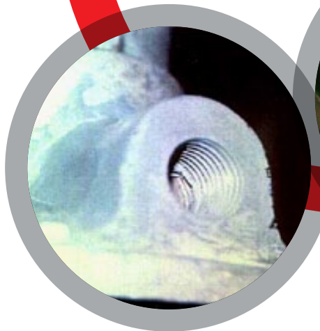
Moulage de filetages arrachés